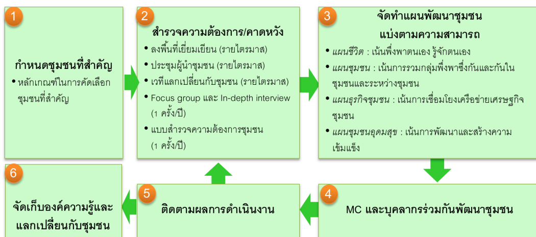
รูปที่ 1 แนวทางการสนับสนุนชุมชน

ซึ่งในการดำเนินงาน ธ.ก.ส. อาศัยความร่วมมือจากภาคีเครือข่ายของธนาคารทั้งที่เป็นทางการและไม่เป็นทางการ อาทิ มหาวิทยาลัย สำนักงานเกษตรอำเภอ/จังหวัด โรงเรียน และวัด ในการบูรณาการดำเนินงานและแบ่งปันทรัพยากรร่วมกันอย่างมีประสิทธิภาพ